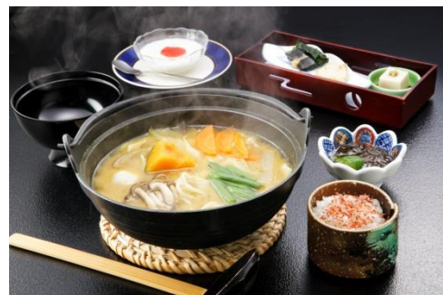
山梨名物「ほうとう鍋」（イメージ）