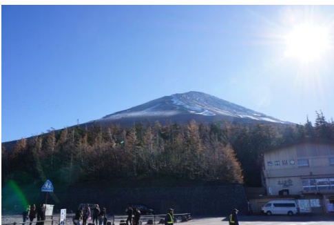
山麓からの富士山頂上（イメージ）

富士エリア ◆富士スバルラインを通行し、晴れた日は山麓から迫力ある富士山をご覧ください。お昼は山梨名物の「ほうとう鍋」をお召し上がりいただきます。