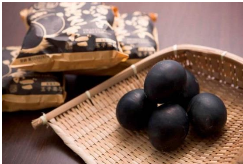
大涌谷名物「黒たまご」（イメージ）

箱根エリア ◆箱根観光の人気スポットである大涌谷を訪れ、ヴェネチアン・ガラスの名品を展示する箱根ガラスの森美術館では、2本の幻想的なクリスタルガラスのツリーをご鑑賞いただきます。