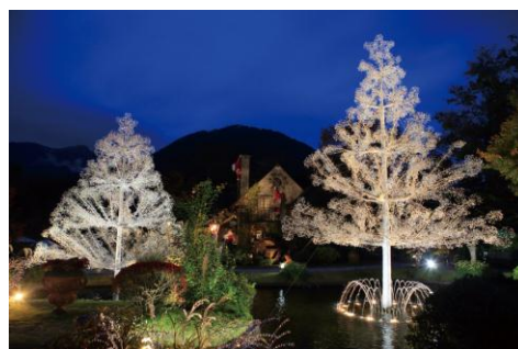
クリスタル・ガラスツリー(イメージ) ※2016年11月1日～2017年3月14日予定