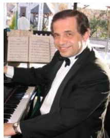
エンゾ・ディ・アマリオ