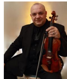
アルベルト・デ・メイス