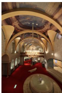
美術館内(イメージ)